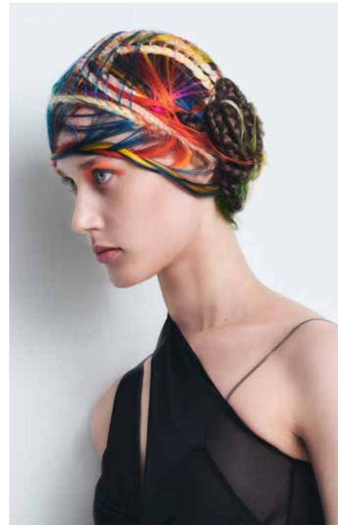
Angelo Seminara für Goldwell