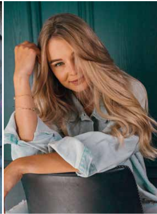
EXTENSIONS: HAIRDREAMS „#inspos“ | TEXT: Ariane Dreisbach